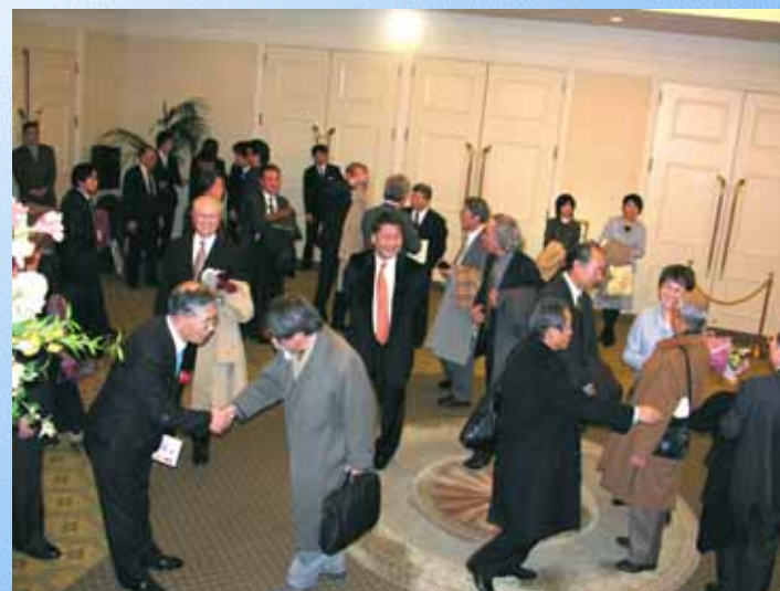
お開き 再会を約束して...