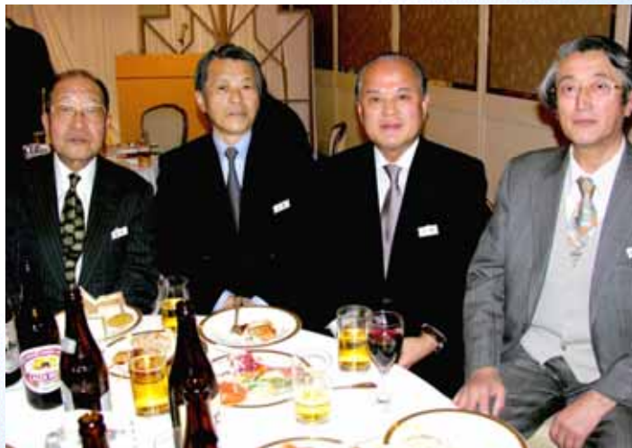
建築会挙げて祝福 建築会歴代会長も...