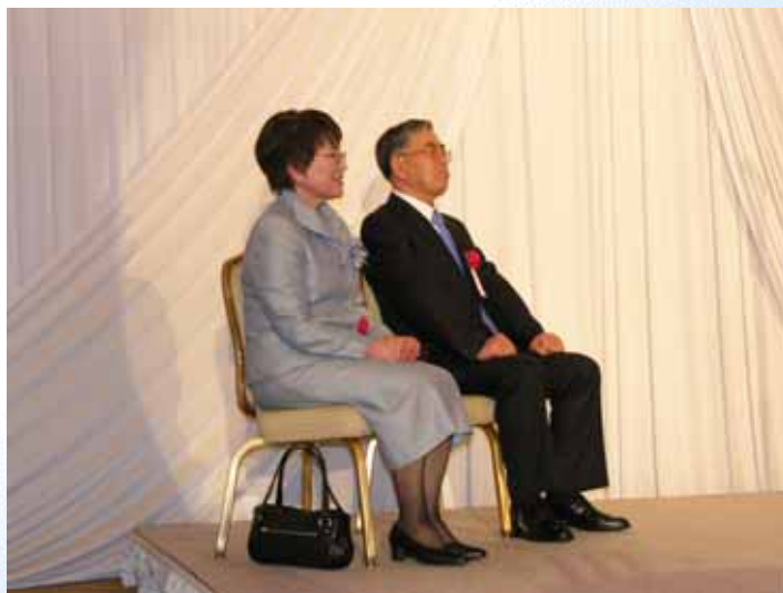
清田先生ご夫妻は壇上で神妙な面持ち