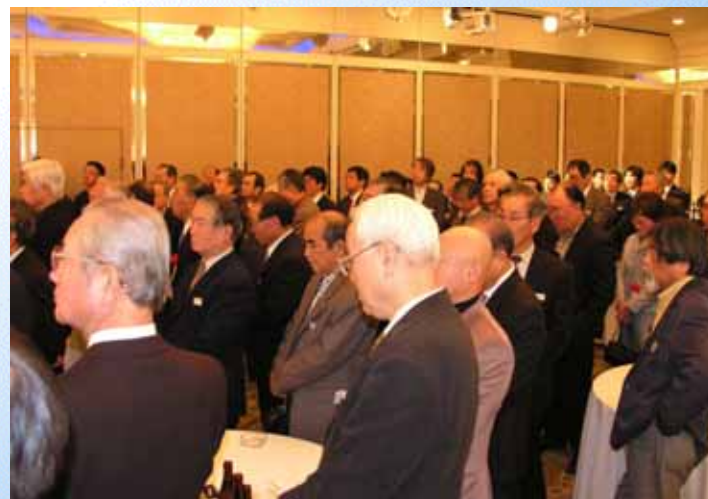
会場は大勢の熱気でムンムン