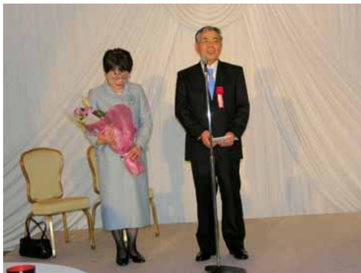
清田先生からお礼のお言葉