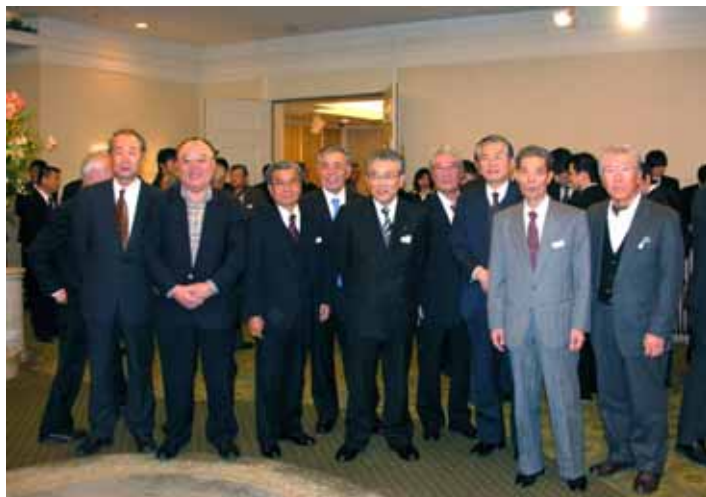
田町校舎近くの「JALシティ田町・東京」で、退職記念パーティを開催