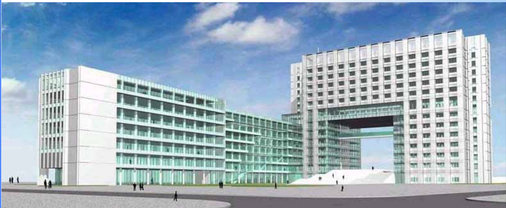
芝浦工業大学 豊洲キャンパス 完成予想図